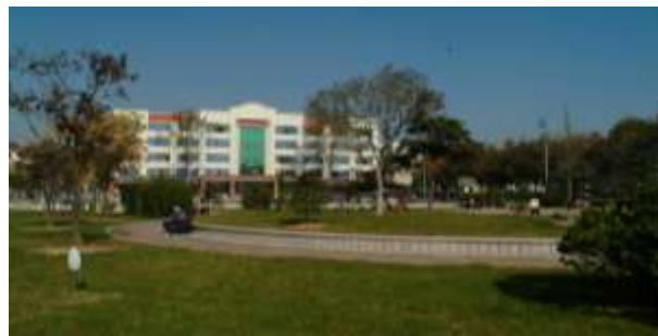
文登职业教育中心